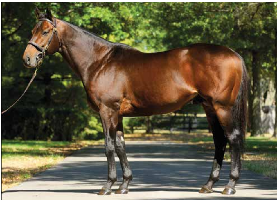
Fotografía: Lee Thomas